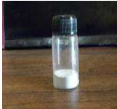
Gambar 4. Hidrolisat protein daging teripang kering