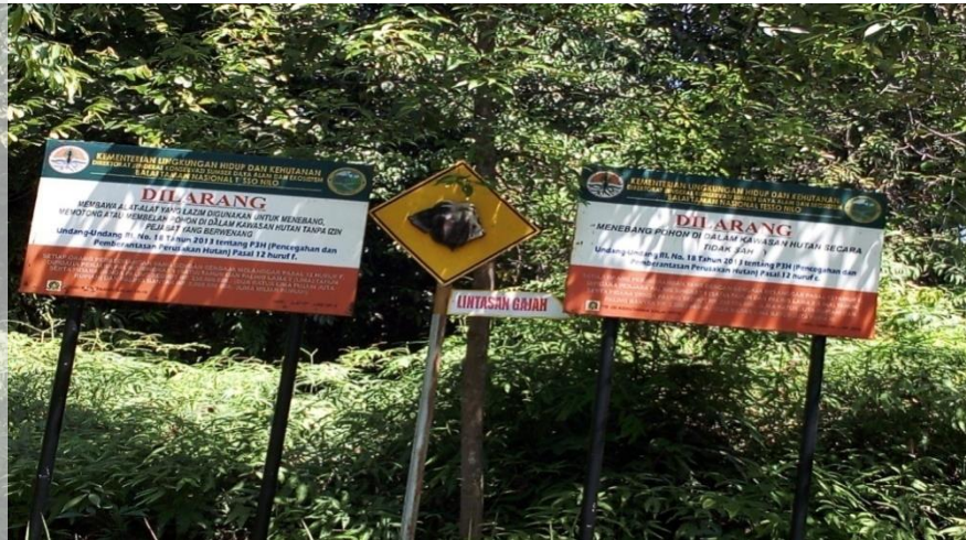
Gambar 3: Papan Informasi Larangan Menebang Pohon kawasan Taman Nasional Tesso Nilo