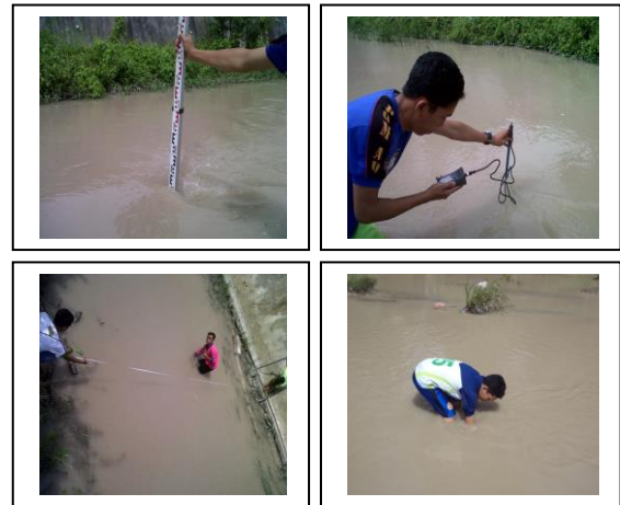
Gbr. 2. Aktivitas Pengambilan Data (ketinggian muka air, kecepatan aliran, lebar sungai, dan sampel sedimen dasar)

dokumen proses pengambilan data seperti pada Gambar 2.