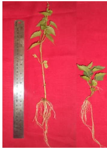
Gambar 3. Morfologi pertumbuhan Mikania micrantha ; (a). Kontrol; (b). Mulsa M. bracteata 2,5 cm.

Dibandingkan dengan hasil penelitian Indraheni (2013) yang menggunakan mulsa Pueraria javanica dan kompos Elaeis guineensis , hasil penelitian menggunakan mulsa daun I. cylindrica , M. bracteata , kompos pelepah kelapa sawit serta kombinasi kompos dengan I. cylindrica maupun kompos dengan M. bracteata ini lebih efektif, karena dengan ketebalan 2,5 cm sebagian besar menghambat perkecambahan mencapai 100%. Ini menunjukkan mulsa daun I. cylindrica , dan M. bracteata , serta kombinasinya antara dengan kompos lebih efektif. Efektivitas ini baru dibuktikan pada salah satu gulma berdaun lebar yaitu Mikania micrantha . Untuk mengetahui efektivitas dari mulsa tersebut terhadap gulma lainnya maka perlu dilakukan aplikasi di lahan.