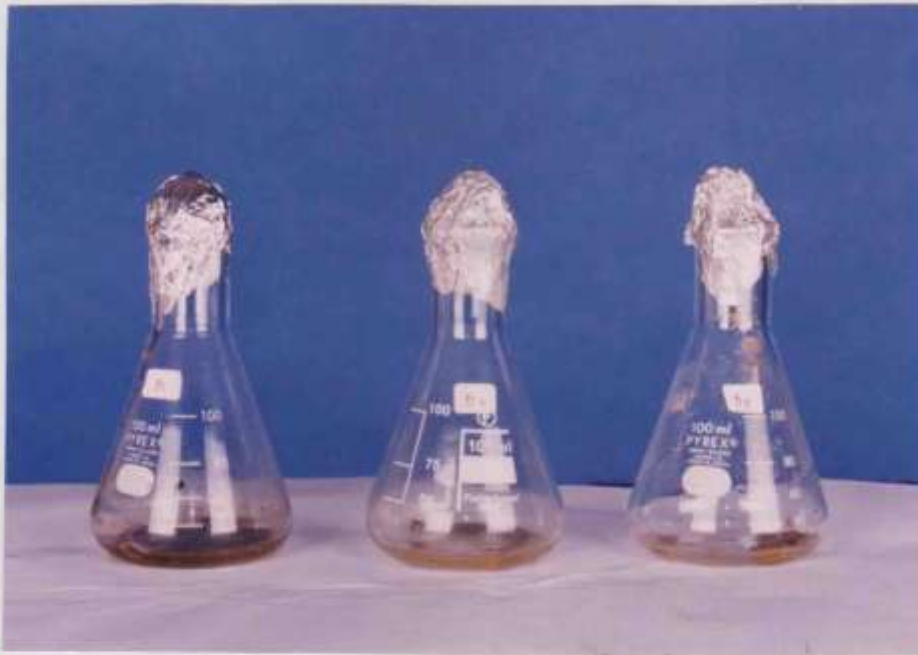
Gambar 1. Pertumbuhan Azotobacter spp pada medium Nitrogen Broth inkubasi 5 hari