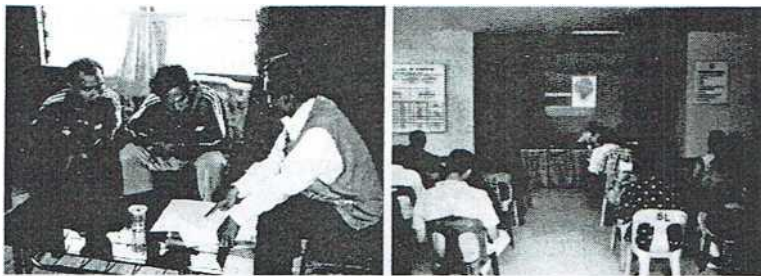
Gambar 1. 3. Kegiatan Pengabdian Masyarakat

Kegiatan di bidang pengabdian masyarakat, meliputi kegiatan- kegiatan membantu dunia usaha/industri dalam menyusun dokumen-dokumen AMDAL, UKL, dan UPL serta penvuluhan, pemberdayaan kepada masyarakat dan usahawan dalam pengelolaan lingkungan. PPLH Univesitas Riau ikut berperan aktif dalam berbagai gerak yang berkaitan dengan pelestarian sumberdaya alam dan lingkungan, antara lain pelestarian mangrove dan terumbu karang.