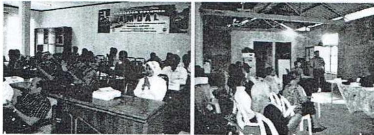
Gambar 1. 4. Kegiatan Layanan Masyarakat

Dalam melaksanakan kegiatannya PPLH UNRI didukung oleh laboratorium yang berada dalam lingkungan Universitas Riau. Diantara laboratorium tersebut adalah : labor-labor dasar dan labor-labor tingkat lanjut, yakni Laboratorium Instrumentasi, Laboratorium Biokimia, Laboratorium Biologi, Laboratorium Tanah, Laboratorium Pengujian Kualitas Air, Laboratorium Ekologi Perairan, Laboratorium Biologi Laut dan Laboratorium Kimia Laut. Dengan dukungan labor-labor tersebut, maka PPLH