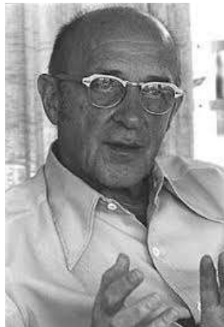
Carl R Rogers