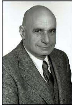
Peter Ludwig Berger

Tahun 1955-1956 Berger bekerja di Evangelische Akademie di Bad Boll, Jerman. Tahun 1956-1958 Berger menjadi Prof muda di Universitas North California, kemudian 1958-1963 karirnya, Berger menjadi Prof Madya di Seminar Teologi Hartford. 1963 hingga 1981 Berger mengajar dan tercatat sebagai Prof di New School for Social Research, Universitas Rutgers dan Boston College. Barulah pada tahun 1981 Berger menjadi Prof bidang Sosiologi dan Teologi di Universitas Boston. Di tahun 1985 Berger dipercaya menjadi Direktur di Institut Studi Kebudayaan Ekonomi.