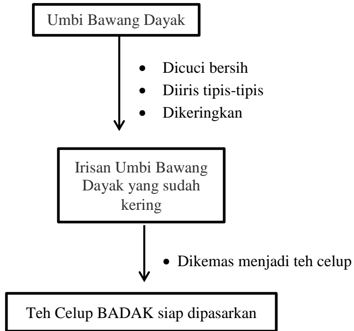
Gambar-3 Bagan Alir Produksi Teh celup BADAK