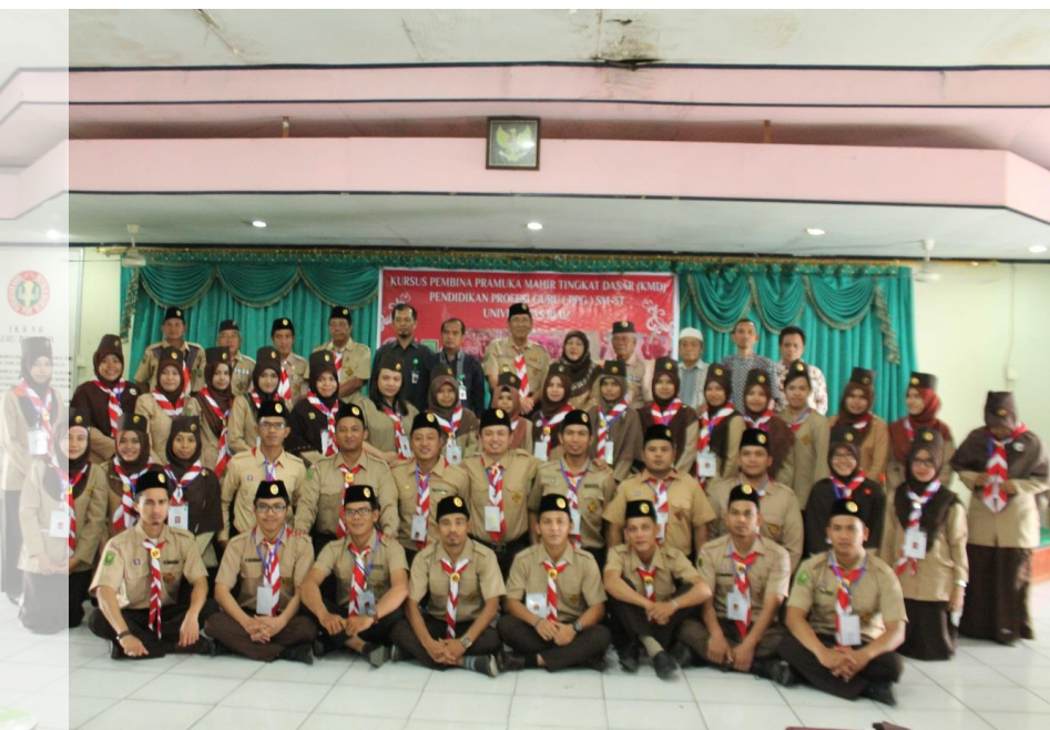
Gambar 2. Peserta bersama Kakak Pembina Kwartir Daerah Riau, WD 1, Koordinator PPG SM3T UR dan Ketua Pengelola Kehidupan Berasrama PPG SM3T UR Tahun 2015.