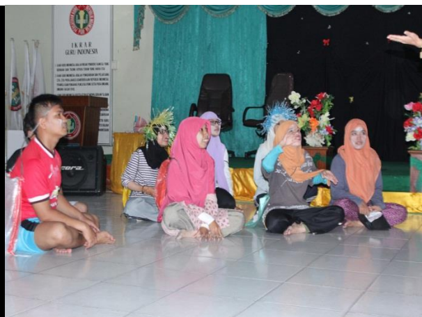
Gambar-B Pementasan Drama dari kelompok peserta yang PPL di SMA Babusalam Pekanbaru.