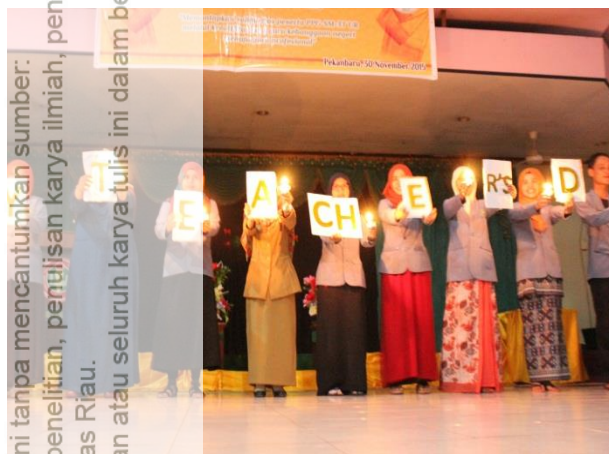
Gambar-C. Pementasan Drama dari kelompok peserta yang PPL di SMAN 8 Pekanbaru.