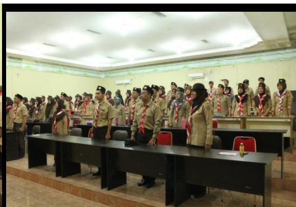
Gambar B. Upaca Pembukaan KMD.