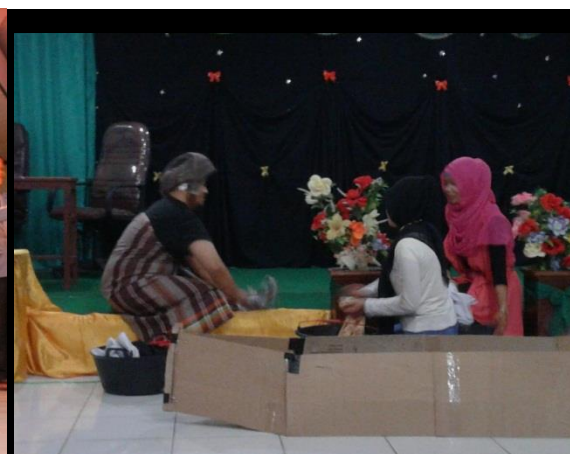
Gambar-D. Pementasan Drama dari kelompok peserta yang PPL di SMAN 12 Pekanbaru.