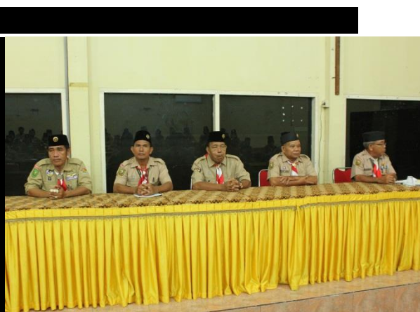
Gambar F. Kakak/ Instruktur KMD Kwartir Daerah Riau.

Kegiatan Peserta dalam mengikuti Kursus Mahir Dasar di Ruangan Tahun 2015.