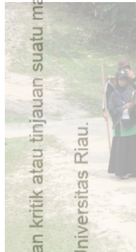
Gambar G. Kerjasama Tim Pencari Jejak.