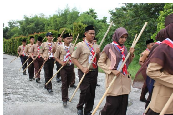
Gambar-E Peserta sedang melaksanakan latihan Semapor di lapangan.