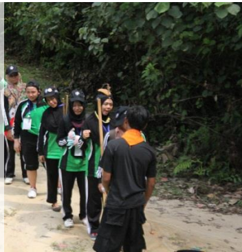
Gambar H. Pelaksanaan Pos-Test