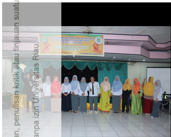
Gambar-A Pementasan Drama dari kelompok peserta yang PPL di SMA Mahanaddiyah Pekanbaru.