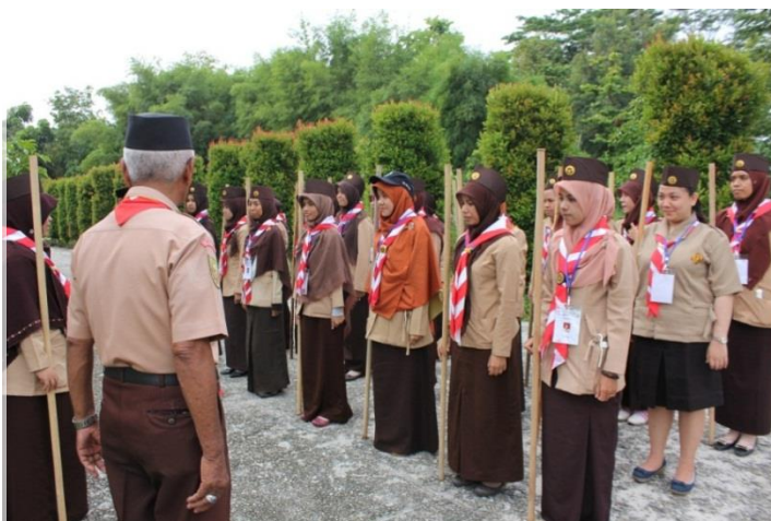
Gambar 11. Acara Penutupan, Penyampaian Pesan dan Kesan dari Kakak Pembina

BAKTIKU ..KU DARMAKAN ....UNTUK JAYA INDONESIA.....INDONESIA TANAH BAKTIKU...AKU JADI PANDUMU, BULATKAN TEKAD !!! MAJU BERSAMA MENCERDASKAN INDONESIA “