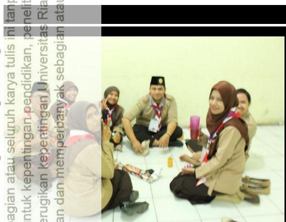
Gambar E Peserta Istirahat Makan siang setelah Mengikuti Materi KMD.