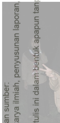
Gambar I. Penutupan KMD dengan Acara Api Unggun (Tingkatkan Solidaritas)