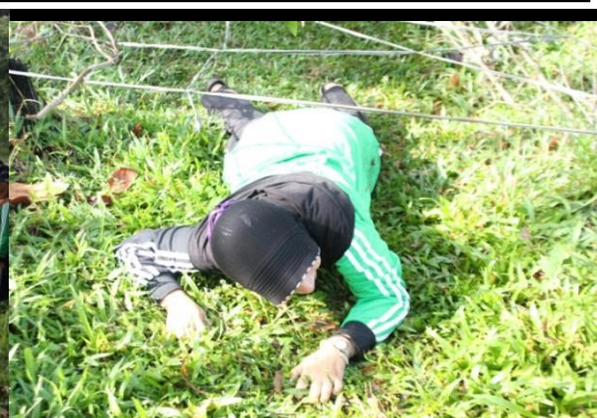
Gambar-C Peserta sedang melaksanakan kegiatan persiapan Jelajah lapangan.