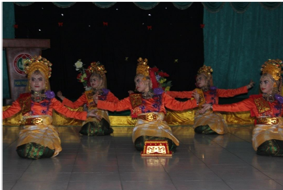
Gambar-1. Penampilan Peserta dalam Acara Pembukaan Malam Kreativitas (Tari Persembahan)