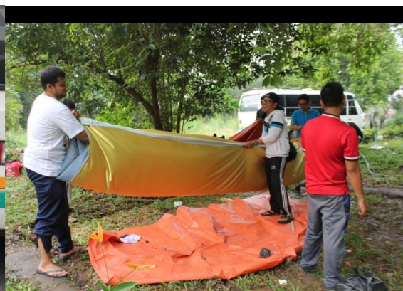
Gambar A Peserta sedang melaksanakan persiapan pemberangkatan ke lapangan. Gambar B. Pemasangan Tenda