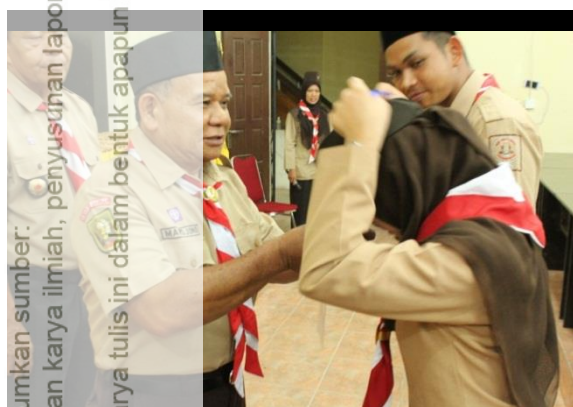
Gambar C Penyerahan Tanda Peserta KMD.