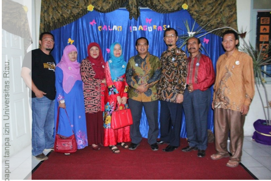
Gambar 6. Dewan Juri Penilai Produk Kreativitas Peserta PPG SM3T Universitas Riau Tahun 2015

2. Dilarang mengumumkan dan memperbanyak sebagian atau seluruh karya tulis ini dalam bentuk apapun tanpa izin Universitas Riau.