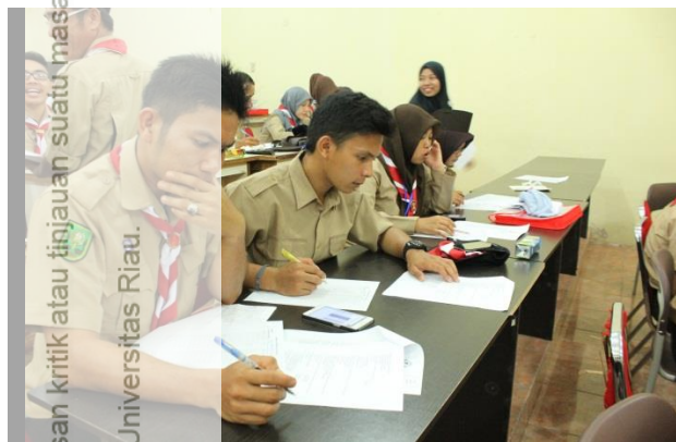
Gambar A Peserta sedang melaksanakan kegiatan Pre-test.