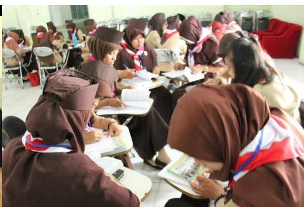
Gambar D. Diskusi Kelompok Materi KMD.