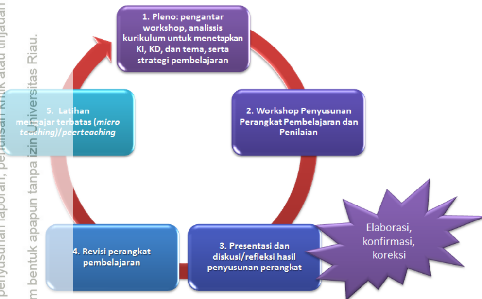
Gambar-2. Siklus Kegiatan dalam Workshop PPG-SM3T.

Workshop mengembangkan perangkat pembelajaran yang mendidik ( subject-specific pedagogy/SSP ) adalah suatu kegiatan dalam PPG yang berbentuk lokakarya. Kegiatan ini bertujuan menyiapkan peserta agar mampu mengembangkan perangkat pembelajaran yang mendidik, sehingga peserta dinyatakan siap untuk melaksanakan Praktek Pengalaman Lapangan. Kegiatan dalam workshop (Gambar-1) diuraikan sebagai berikut: