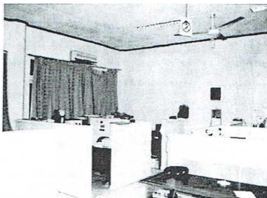
Gambar 7. 1. Ruang Kerja Staff Kantor PPLH Universitas Riau

Memperhatikan fasilitas yang dimiliki oleh PPLH sebelum melaksanakan revitalisasi, maka revitalisasi memandang perlu untuk lebih meningkatkan fasilitas yang ada saat ini. Diharapkan melalui program pengadaan fasilitas akan dapat meningkatkan dan memperbaiki sarana pendukung yang ada saat ini, sehingga dapat meningkatkan kinerja PPLH Universitas Riau kedepan. Beberapa fasilitas pendukung yang akan diadakan adalah fasilitas yang berhubungan dengan teknologi informasi.