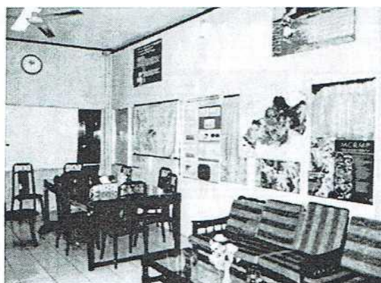
Gambar 7. 2. Website PPLH Universitas Riau

Website PPLH Universitas Riau (Gambar 7.3) yang dapat diakses melalui web www.pplh.unri.ac.id merupakan bagian dari kegiatan untuk perkuatan jejaring kerjasama. Website PPLH Universitas Riau ini berisikan tidak hanya mengenai profil dan sejarah PPLH saja tetapi melingkupi program dan evaluasi program yang telah dilaksanakan oleh PPLH Universitas Riau sehingga memudahkan berbagai pihak untuk mengaksesnya. Melalui website ini diharapkan adanya peningkatan sosialisasi kegiatan PPLH Universitas Riau terhadap masyarakat umum, Pusat studi lingkungan lainnya maupun pemerintah. Berikut ini merupakan gambar dari bagian website PPLH Universitas Riau yang telah dibuat.