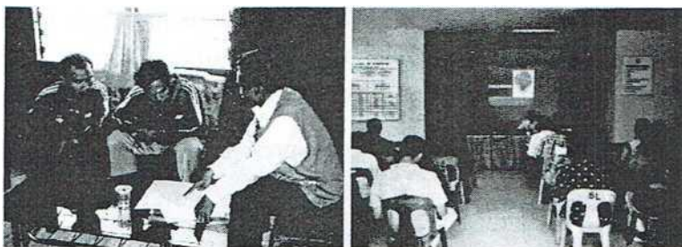
Gambar 1. 3. Kegiatan Pengabdian Masyarakat

Kegiatan di bidang pengabdian masyarakat, meliputi kegiatan- kegiatan membantu dunia usaha/industri dalam menyusun dokumen-dokumen AMDAL, UKL, dan UPL serta penvuluhan, pemberdayaan kepada masyarakat dan usahawan dalam pengelolaan lingkungan. PPLH Univesitas Riau ikut berperan aktif dalam berbagai gerak yang berkaitan dengan pelestarian sumberdaya alam dan lingkungan, antara lain pelestarian mangrove dan terumbu karang.