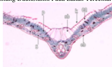
Gb 2. Penampang melintang Daun Sianik Pada Lahan Tidak Tercemar Hidrokarbon Petroleum