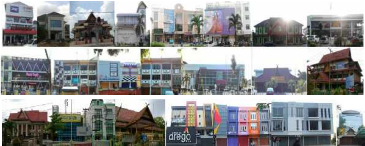
Gambar 8. Segmen 1A