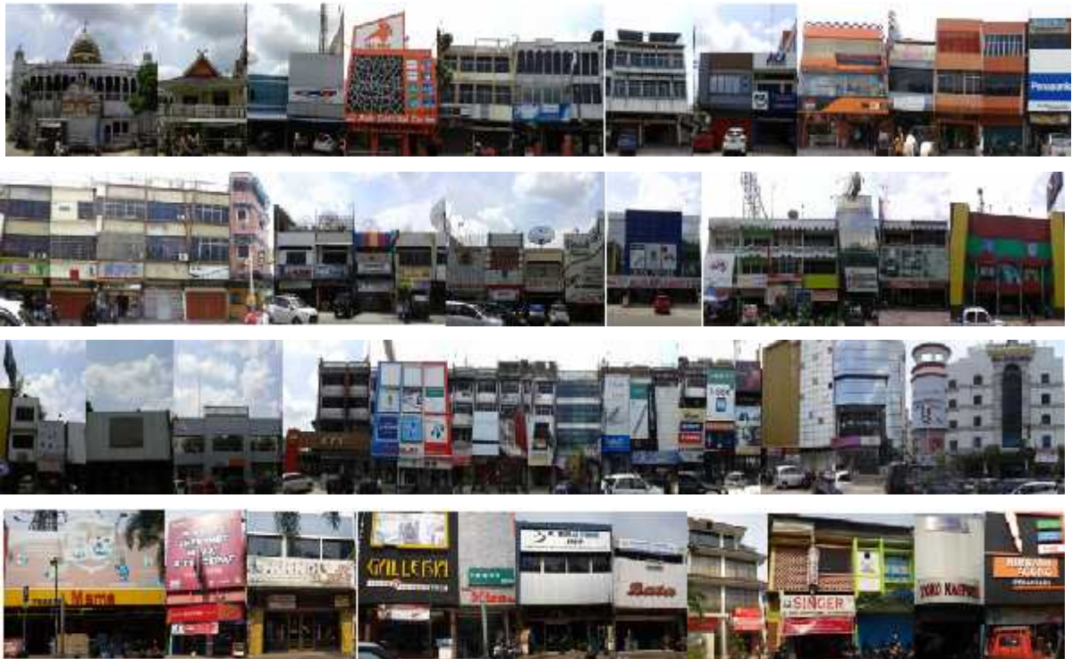
Gambar 11. Segmen 3B