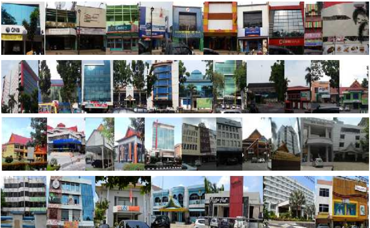
Gambar 12. Segmen 2B