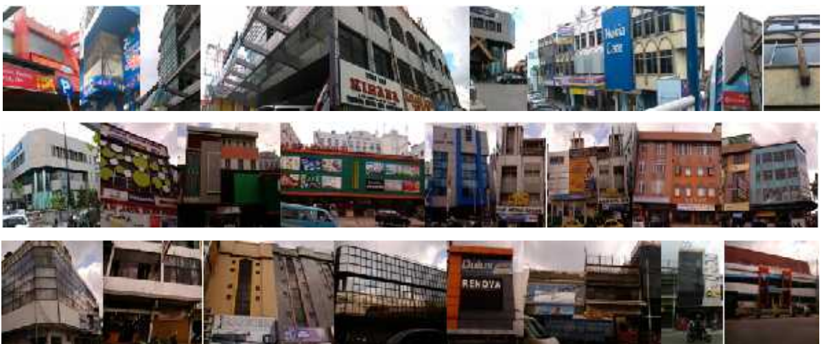
Gambar 10. Segmen 3A