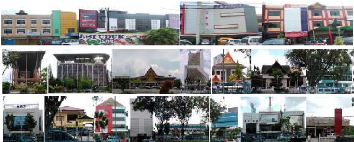
Gambar 9. Segmen 2A