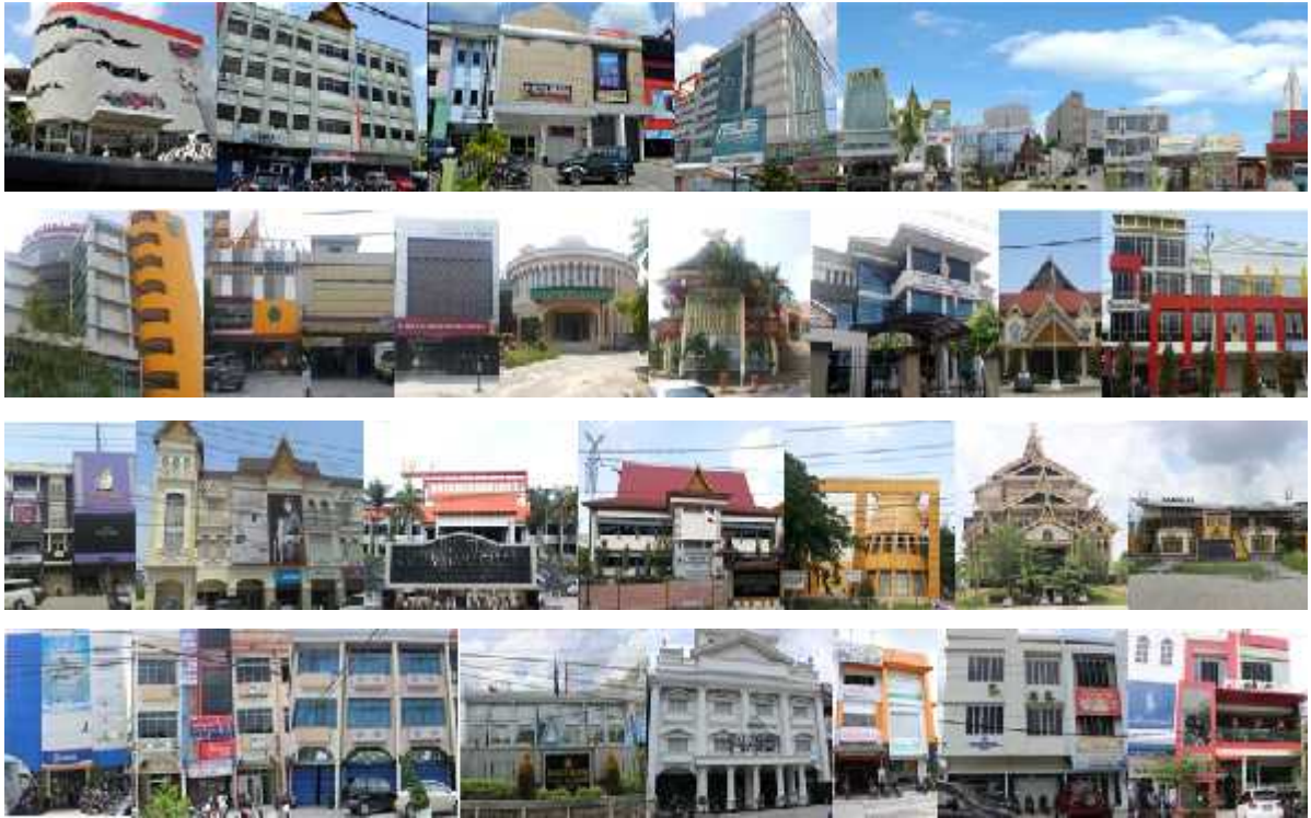
Gambar 13. Segmen 1B