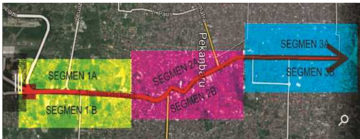
Gambar 7. Pembagian segmen wilayah amatan

Keadaan kawasan Jalan Jendral Sudirman saat ini masih terdiri dari beberapa jenis bangunan, yaitu bangunan ruko (kegiatan perdagangan), Perkantoran, Hotel, dan Bangunan perdagangan. Terdapat lebih dari puluhan bangunan di sepanjang Jalan Jendral Sudirman, dengan berbagai gaya dan bentuk. Berdasarkan hasil pengamatan, terdapat beberapa bangunan yang tampil dengan fasade baru, dan sebagian lagi merupakan fasade lama.