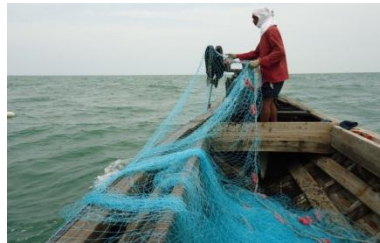
Gambar 7. Pengoperasian net hauler

Mekanisme kerja dari net hauler diawali dengan memasukkan tali ris atas ke dalam bagian kepala net hauler . Selanjutnya tali ris atas yang masuk akan di arakan oleh roller yang kecil dan melingkari roller yang besar. Setelah melalui roller yang besar, tali ris atas akan jatuh ke palka tempat jaring kurau. Peletakan net hauler pada kapal kurau adalah pada bagian depan haluan kapal.