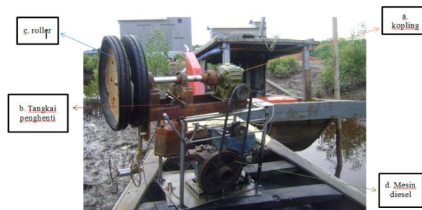
Gambar 5. Net hauler mesin diesel untuk menarik jaring kurau

Dalam pengoperasian jaring kurau nelayan menggunakan alat bantu penangkapan, alat bantu penangkapan yang digunakan nelayan adalah net hauler (nelayan tempatan menyebut alat ini dengan robot). Dari hasil pengamatan, net hauler yang digunakan nelayan di Desa Teluk Pambang semuanya sama, hanya saja yang membedakannya motor penggerak, net hauler hidrolik dan net hauler mesin diesel.