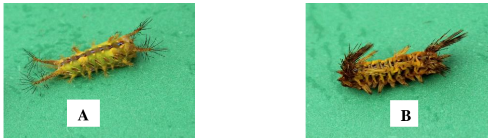
Gambar 1. Larva Setora nitens setelah aplikasi

Gejala awal kematian larva Setora nitens ditandai oleh perubahan perilaku yaitu pergerakan mulai kurang aktif dalam memakan daun sawit, tubuh mulai kurang segar, terjadi perubahan warna tubuh dari warna kehijauan muda menjadi kuning kecokelatan, larva Setora nitens mengeluarkan cairan dari tubuh dan menjadi keriput (Gambar 1). Semakin tinggi konsentrasi ekstrak tepung buah sirih hutan yang diberikan maka akan semakin cepat menunjukkan gejala awal kematian larva Setora nitens . Hal ini disebabkan semakin banyak senyawa aktif piperamidin yang masuk ke dalam tubuh larva Setora nitens . Senyawa aktif tersebut masuk dengan cara racun kontak yang masuk ke dalam tubuh serangga melalui kulit tubuh serangga pada saat pemberian insektisida atau dapat pula terkena sisa insektisida (residu) beberapa waktu setelah penyemprotan (Untung, 2001).